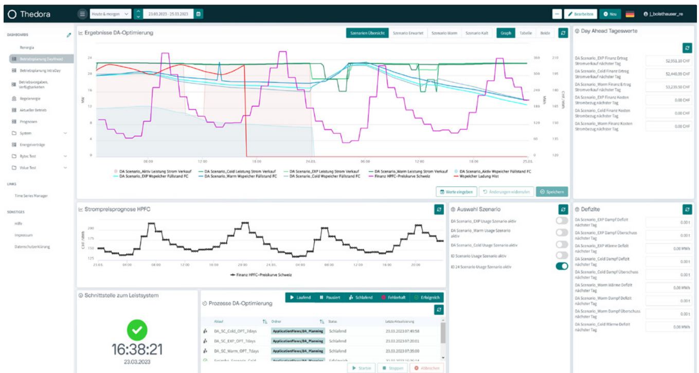
02 Das Dashboard reduziert die Komplexität der Einsatzoptimierung.

Das Dashboard bietet einfach zu bedienende Widgets. Das reduziert die Komplexität und die Optimierungssoftware Bofit kann im Hintergrund arbeiten. Die Widgets lassen sich konfigurieren, sodass Anwendende sich ihre individuelle Arbeitsoberfläche zusammenstellen können. Da das Cockpit auch mit dem Leitsystem der Abfallverwerter kommuniziert, kann es dort aktuelle Daten des Anlagenbetriebs darstellen und umgekehrt die im Leitsystem benötigten Fahrpläne liefern.