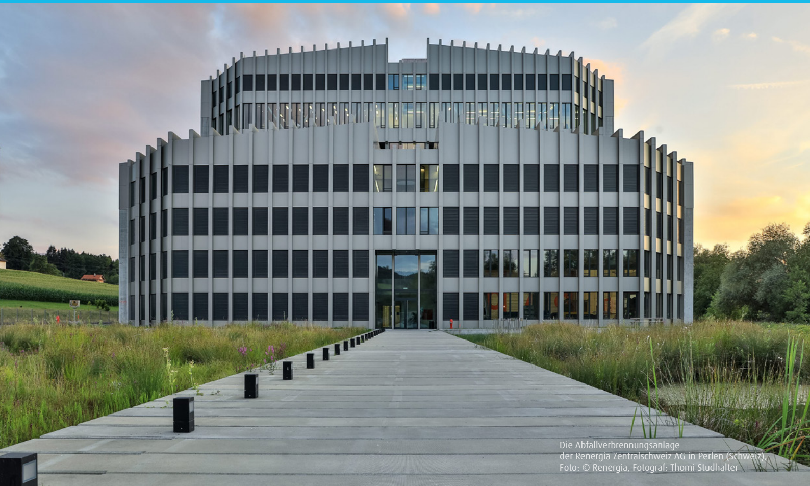
Die Abfallverbrennungsanlage der Renergia Zentralschweiz AG in Perlen (Schweiz).