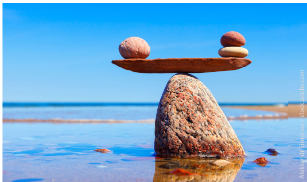
Abbildung 1: Verhandlungen auf Augenhöhe mit dem EVU.

Die Rytec vertritt die Interessen der abonnierten KVA im Strommarkt. Die KVA baut selbst eine gewisse Marktkompetenz auf und entwickelt eine Strategie bei der Stromvermarktung. Die KVA wird auf die wichtigen Ereignisse an den Märkten hingewiesen und erhält laufend Empfehlungen für ihr Marktverhalten.